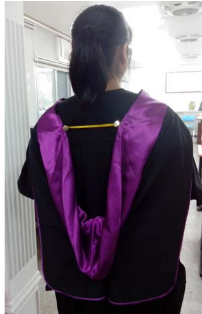
披肩穿戴方式(背面樣式)